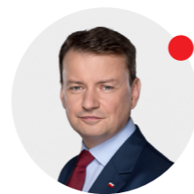
Mariusz Blaszczak minister obrony narodowej