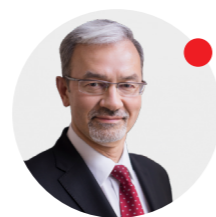
Jerzy Kwieciński minister inwestycji i rozwoju