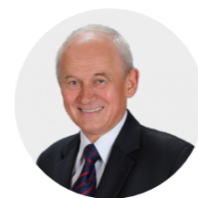
Krzysztof Tchórzewski minister energii