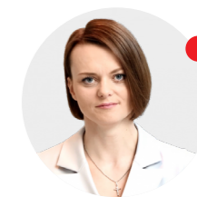
Jadwiga Emilewicz minister przedsiębior- czości i technologii