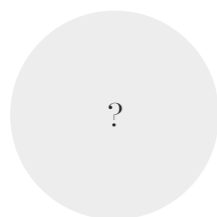
czeka na powołanie minister cyfryzacji