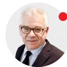
Jacek Czaputowicz minister spraw zagranicznych