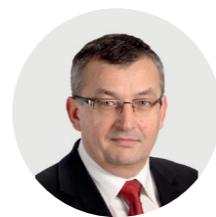
Andrzej Adamczyk minister infrastruktury