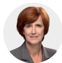
Elżbieta Rafalska minister rodziny, pracy i polityki społecznej