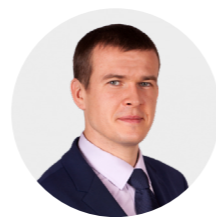
Witold Bańka minister sportu