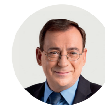
Mariusz Kamiński minister -koordynator służb specjalnych