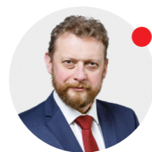
Łukasz Szumowski minister zdrowia