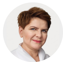
Beata Szydło wicepremier ds. społecznych