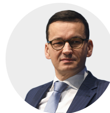
Mateusz Morawiecki premier