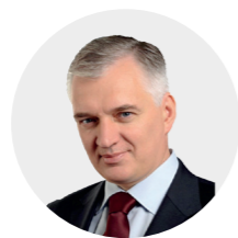
Jarosław Gowin wicepremier i minister nauki