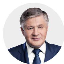
Krzysztof Jurgiel minister rolnictwa