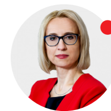
Teresa Czerwińska minister finansów