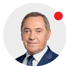
Henryk Kowalczyk minister środowiska