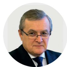
Piotr Gliński wicepremier i minister kultury