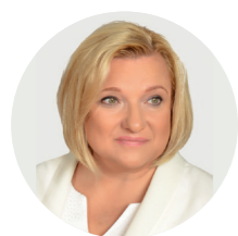
Beata Kempa minister ds. pomocy humanitarnej