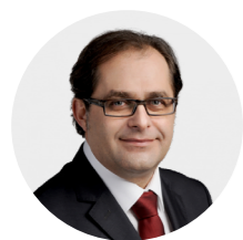
Marek Gróbarczyk minister gospodar- ki morskiej i żeglugi śródlądowej